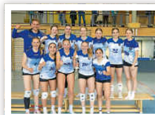
U20w Pokalfinale, Pokalsieg