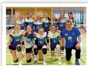
U16w Pokalfinale, Platz 2

Am Samstag fand das Pokalfinale U16 weiblich auf der Waldau in Stuttgart statt. Mitbeteiligt waren die Volleyballerinnen der U16w des TSV Flacht. In der Vorrunde konnte das erste Spiel gegen Bad Waldsee Dank starker Aufschläge klar gewonnen werden. Das zweite Spiel gegen Möckmühl ging im dritten Satz verloren, da das Team in diesem Spiel nicht konstant genug spielte. Trotz der Niederlage wurde das Halbfinale erreicht. Im Halbfinale gegen Friedrichshafen spielte das Team dann in den Sätzen 2 und 3 stark auf und zog verdient in das Finale. So kam es wie so oft zu einem Finale zwischen dem Tübinger Modell und den Blaubären Flacht. Dieses Mal reichte dann am frühen Abend die Kraft nicht mehr, um das Turnier zu gewinnen. Insgesamt spielte das Team ein starkes Turnier und bestätigte mit starken Spielzügen das Potential im Team.