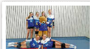
U13w Württembergische Meisterschaften – ein toller Platz 10.

Topleistungen aller Jugendteams und mal wieder dem Ländle gezeigt, wie stark der Nachwuchs aus Flacht ist. Flacht kann halt nicht nur 1. Liga, sondern auch Jugend.