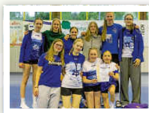
U18w-Pokalfinale, Platz 3.