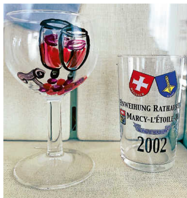
Freundschaftsgaben aus Marcy-l'Étoile im Museum

Das geht am besten, wenn sich Menschen persönlich begegnen, miteinander sprechen, essen und trinken und so das „Projekt Europa“ jenseits politischer Sonntagsreden mit Leben füllen.