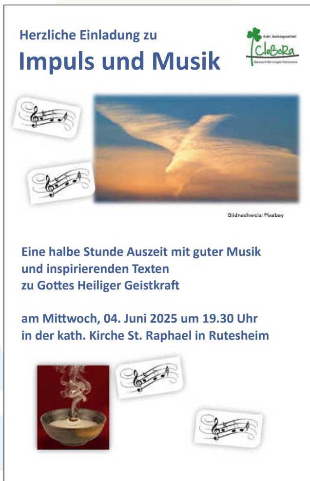
Plakat: C. Vogelmann