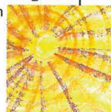
Plakat: Ev. Kirchengemeinden Weissach und Flacht

In künstlerischer, kreativer Tätigkeit und Interaktion werden körperliche, geistige und seelische Kräfte und Fähigkeiten angeregt. Sie kommen in Bildern und gemeinsamem Austausch zum Ausdruck. Diese Arbeit stellt Ihnen Dorothea Wiggerhauser vor.