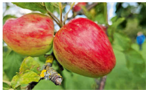
Früchte vom sog. Postmichelapfelbaum in Weissach.