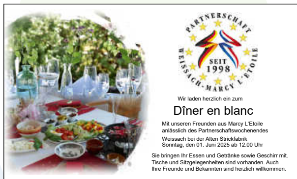
Dîner en blanc

Wir würden uns über eine rege Teilnahme freuen. Zum Dîner en blanc bringen Sie alles mit, was Sie zu einem gemütlichen Picknick benötigen. Für Tische und Sitzgelegenheiten ist gesorgt. Weiße Kleidung gehört eigentlich zu einem Dîner en blanc, aber es ist keine Verpflichtung. Wir freuen uns über Ihre persönliche Teilnahme. Gerne können Sie auch Freunde, Bekannte und Familie mitbringen.