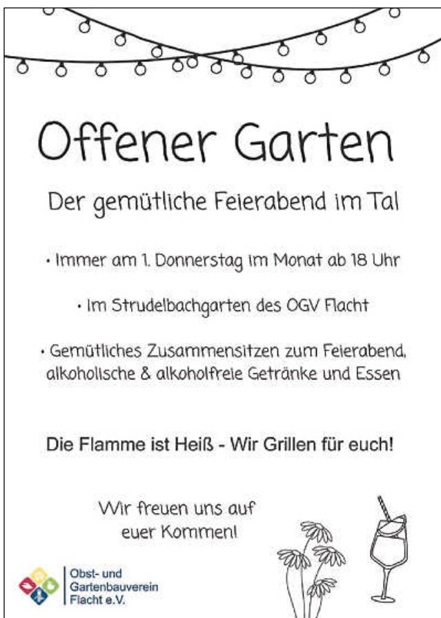
Plakat: OGV Flacht e.V.