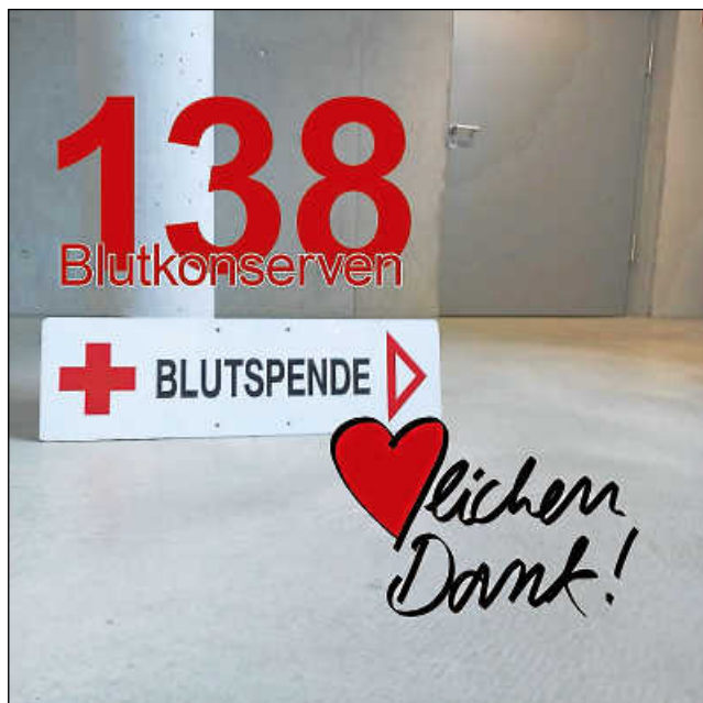
Plakat: DRK Weissach-Flacht

Unsere nächste Aktion ist am 22. November – am besten heute schon vormerken!