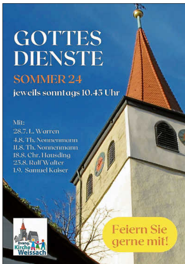
Plakat: Ev. Kirchengemeinde Weissach

Das Pfarrbüro ist freitags von 8 bis 10 Uhr und dienstags von 14 bis 16 Uhr geöffnet.