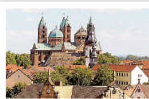
UNESCO Welterbe: Der Dom zu Speyer

Die Gemeinde Weissach und der DRK-Ortsverein laden alle unternehmungslustigen Rentnerinnen und Rentner mit Wohnsitz in Weissach zu einem gemeinsamen Ausflug ein. Am Samstag, 14. September 2024 , geht's los – unsere Tour führt uns nach Karlsruhe mit einer Stadtrundfahrt und im Anschluss nach Speyer .