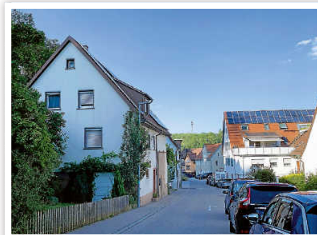
Viel hat sich verändert in der Friolzheimer Straße. Das Haus – mittlerweile verputzt – steht noch, die Pappeln sind verschwunden.