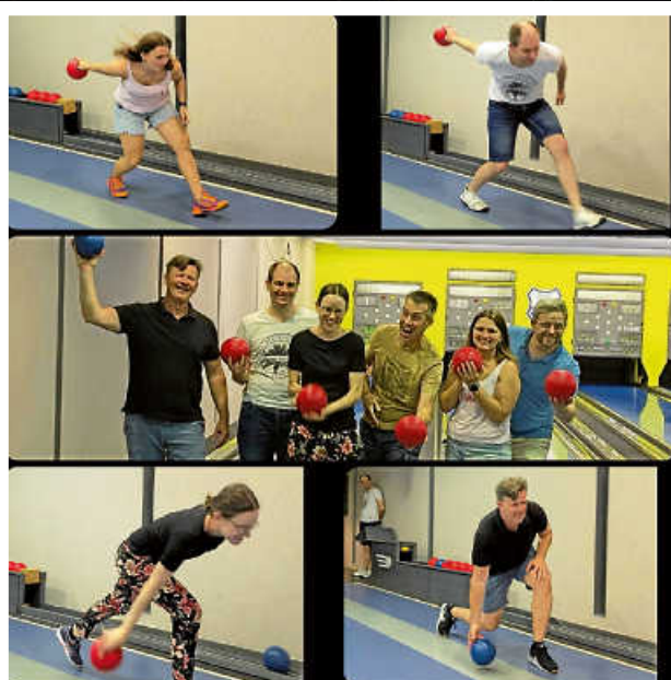
Lustiger Kegelabend mit Top-Haltungsnoten.

Es gibt kein schlechtes Wetter, es gibt nur schlechte Kleidung. Somit waren wir bis jetzt außerhalb der durch's Sommercamp gesperrten Sporthalle sehr spontan und flexibel mit dem Sport treiben: