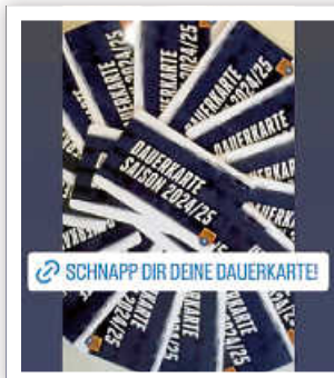
Dauerkarte Saison 2024/2024

Die Saison 2024/2025 steht vor der Tür. Mit 14 Mannschaften und damit 13 Heimspielen (plus weitere durch Test- und Pokalspiele) startet sie am 21.09.2024. Das erste Heimspiel in der Bärenhöhle findet am 28.09.2024 statt, das Testspiel zum Saisonauftakt bereits am 14.09.2024. Ihr, liebe Blaubären, könnt ab sofort die Dauerkarte für die kommende Saison vorbestellen.