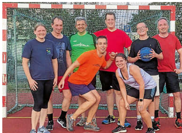
Basketball in der Abendsonne.

Wir – die Afterwork Sportgruppe – verabschieden uns jetzt in die verdiente Sommerpause!