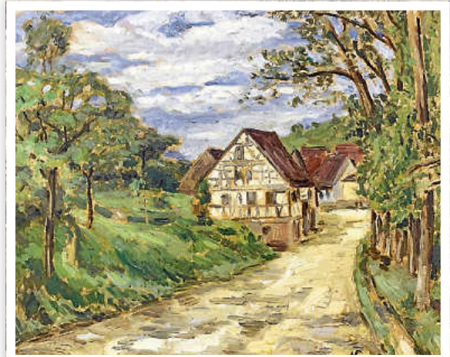
Nach dem Motiv für dieses Gemälde von Sepp Vees suchten wir im vorletzten Blättle.