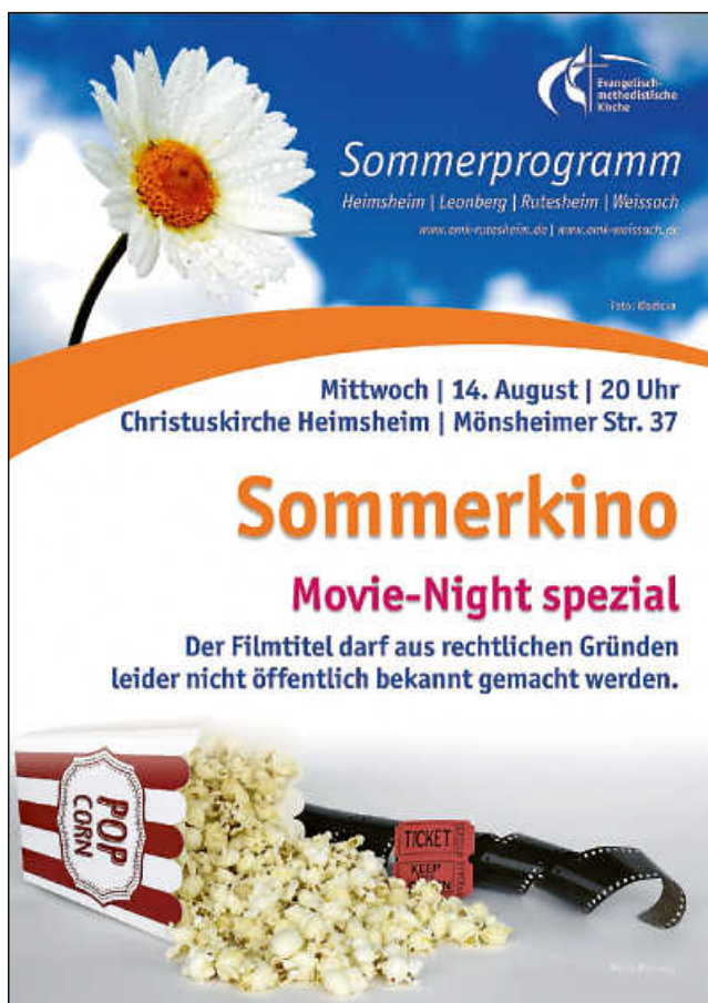
Plakat: EmK Weissach