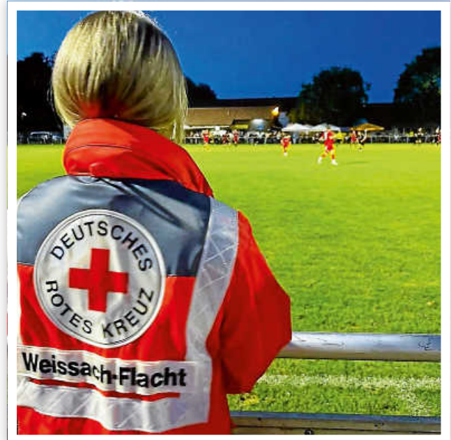
Momentaufnahme Finale Eugen-Essig-Turnier beim TSV Flacht

Sanitätsdienst heißt, da zu sein, für unsere Mitmenschen in der Gemeinde, Auskünfte zu geben bei Fragen zum Ortsverein, Botschafter sein für das Rote Kreuz, mithelfen, evtl. Hemmungen und Ängste vor „roten Kitteln“ abzubauen, Kinder neugierig zu machen und Trost zu spenden. Mal ein Pflaster kleben, wo vielleicht keines gebraucht wird, um im Notfall dann blitzschnell umzuschalten, Gelerntes abzurufen, auf den Menschen mit seinem akuten Problem einzugehen, Entscheidungen für die richtigen Maßnahmen zu treffen, Ruhe bewahren, wenn andere hektisch werden.