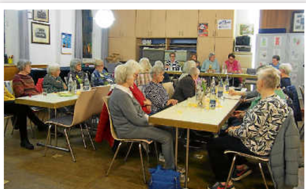
Der Vorstand berichtete über seine Arbeit

Am 28.2.2024 fand die Jahreshauptversammlung unseres Ortsverbandes der LandFrauen Weissach-Flacht im Sängerkheim in Weissach statt. Nach der Begrüßung durch die Vorsitzenden wurde die Situation des Ortsverbandes erläutert und auf die Mitgliederzahlen eingegangen.