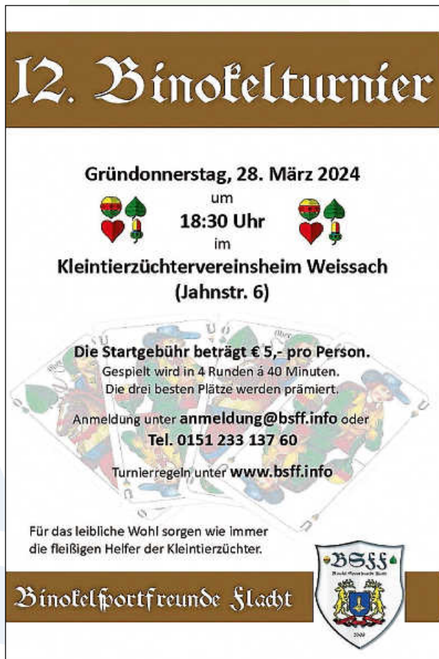
Plakat: Binokelsportfreunde Flacht

Es grüßen die Binokelsportfreunde Flacht