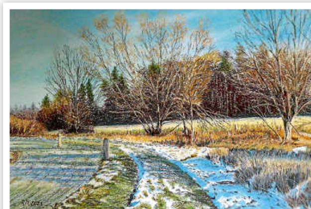
Winter am Schlupfbach/Bonlanden, Pastell