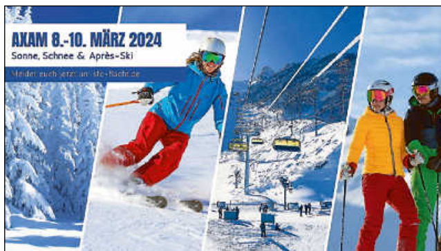
Grafik: Sabine Dangel

Noch freie Plätze bei unserer Skiausfahrt nach Axam! Schnell anmelden, alle Infos auf unserer Website sfc-flacht.de