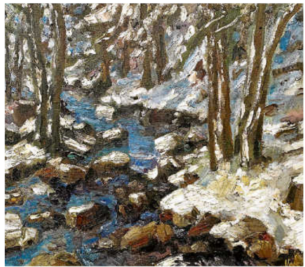
Bach im Winter