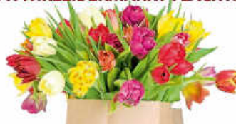
Plakat: DRK Weissach-Flacht

Weitere Infos unter WWW.KLEIDERMARKT-FLACHT.DE