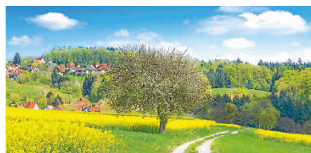
Frühlingslandschaft zwischen Schorndorf und Welzheim