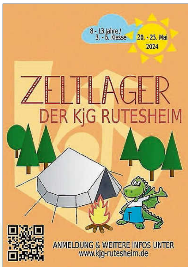
Plakat: KJG Rutesheim

Anmeldung und weitere Infos unter kjg-rutesheim@gmx.de