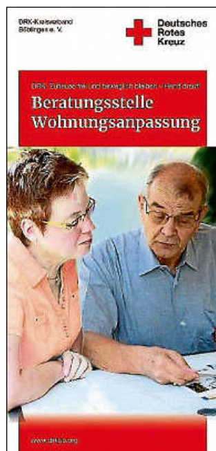
Plakat: DRK KV Böblingen

Doppke, wohnberatung@drkbb.org , Tel. 07031 6904-403