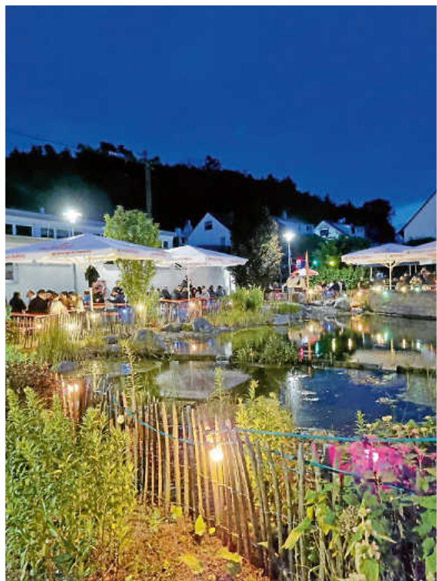
Sommerabendliche Atmosphäre am Feuersee