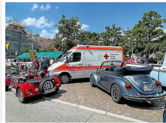
Oldtimer Treffen des OCW in Weissach.

Mittendrin statt nur dabei! Das war unser Motto am Wochenende. Am Samstag standen wir für eine schnelle Erste Hilfe, sofern sie benötigt worden wäre, am Seefest zur Verfügung und am Sonntag mitten drin auf dem Weissacher Marktplatz, direkt an der Durchfahrt für die wunderschönen und faszinierenden Oldtimer.