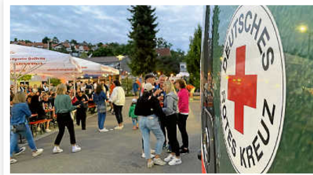
Seefest beim Ski- und Freizeitclub in Flacht.

Bis auf ein Pflaster hier und da waren beide Dienste recht ruhig und boten dennoch eine gute Gelegenheit für Gespräche mit Interessierten an unserer Vereinsarbeit.