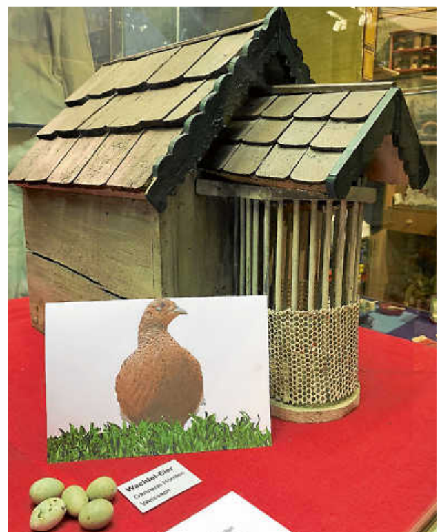
Auf dem halbrunden, vergitterten Vorbau des Wachtelhäuschens hatte der Wachtelhahn beim Singen seinen großen Auftritt.