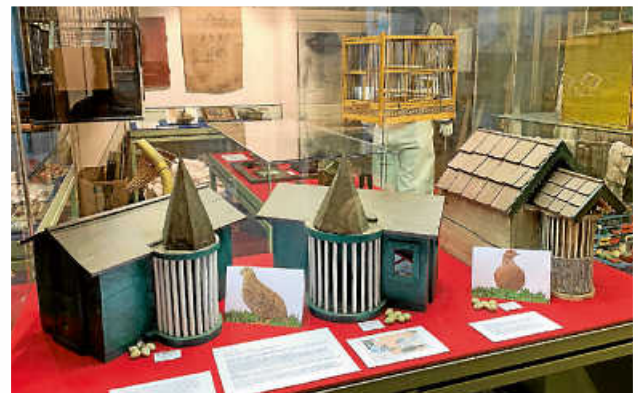
Blick in die Vitrine mit den Wachtelhäusern im Heimatmuseum in Flacht.