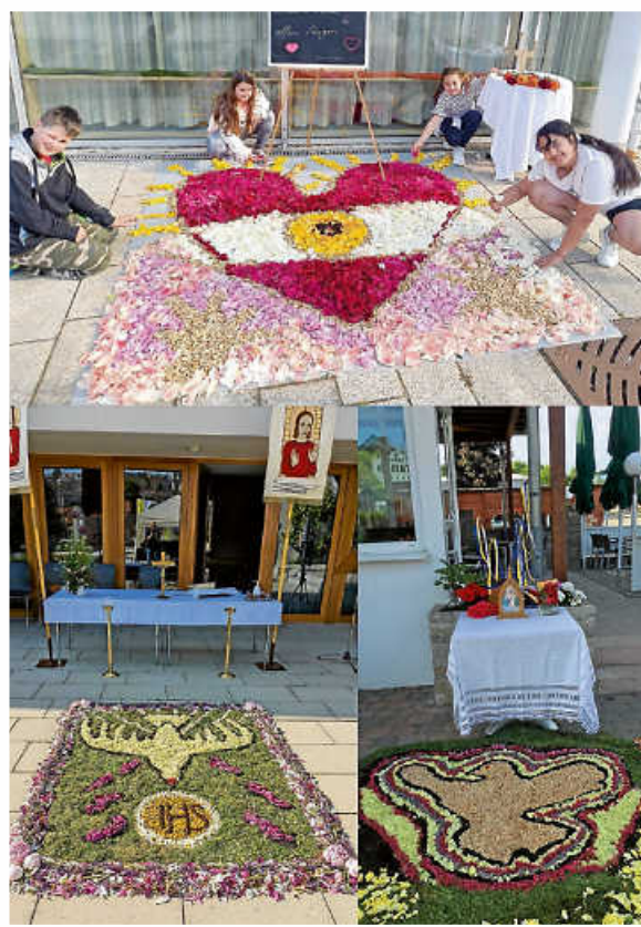
Blument Teppich Kirchplatz, Rosa-Körner-Stift, Pizzeria Stazione da Franco

DANKE ... allen Ordnern & fleißigen Helfern und Ehrenamtlichen für Eure tatkräftige Unterstützung!