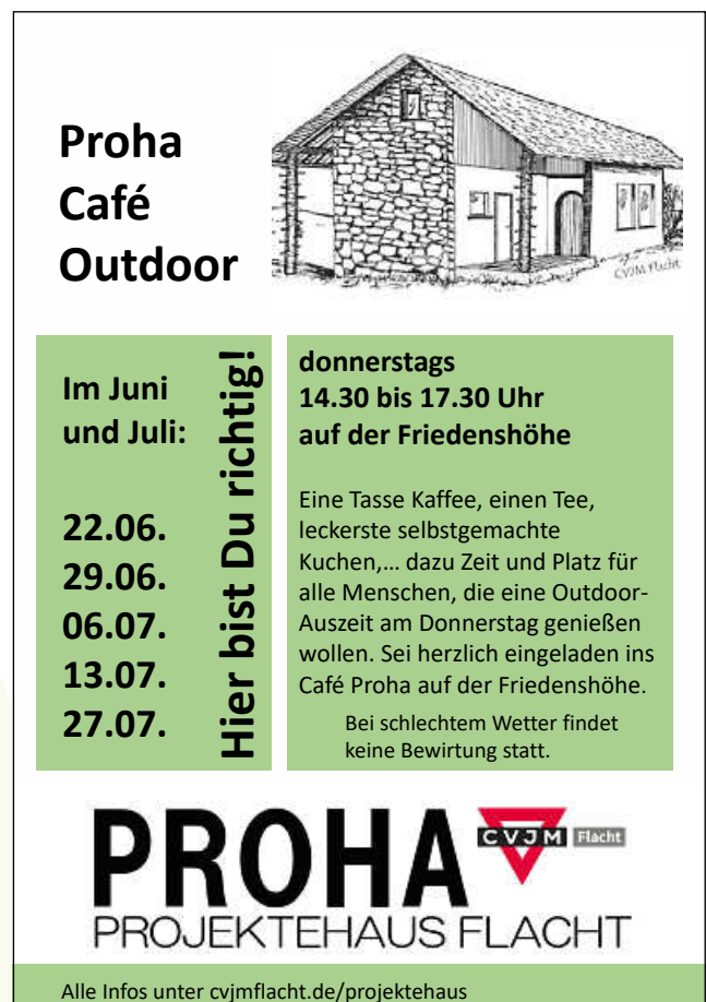
Plakate: ProHa Team