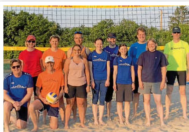
12 Teilnehmer beim ersten Freiluftsport 2023 – rekordverdächtig!! 5x war sogar unser neues eigenes T-Shirt am Start.

Am vergangenen Freitag haben wir – die „Afterwork“ Gruppe – bei tollen Temperaturen begonnen, wieder draußen zu spielen. Nachdem wir mit vereinten Kräften das Netz aufgebaut, den Sand einmal durchgereicht und die Linien gelegt hatten, konnten wir mit toller, lustiger Stimmung und einigen Hecht-Einsätzen – um den Ball zu bekommen – endlich wieder loslegen, nachdem wir uns wegen der Pfingstferien/Urlaubszeit zwei Wochen Zwangs-Pause gönnen mussten.