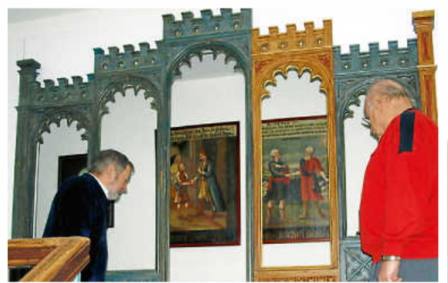
Schauen mit Abstand 2020.

Der Museumsverband Baden-Württemberg blickt mit Sorge auf die sich verschärfende Infektionslage, die Maßnahmen von Bund und Ländern zur Eindämmung der Pandemie notwendig gemacht hat. Der Verband betont aber, dass die Museen schon in den vergangenen Monaten ihren Beitrag zur Sicherheit im Museumsbetrieb geleistet haben. Deshalb fordert er die Entscheidungsträger auf, die Museen als sichere und gerade in krisenhaften Zeiten gesellschaftlich wichtige Orte der Bildung baldmöglichst wieder zu öffnen.