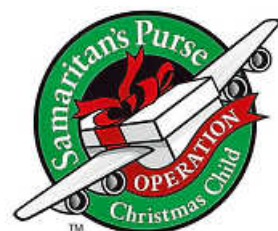
Grafik: Weihnachten im Schuhkarton