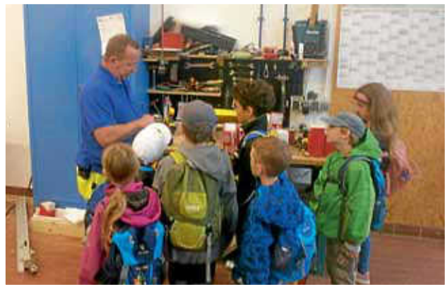
In der „Kfz-Werkstatt“ des Bauhofes