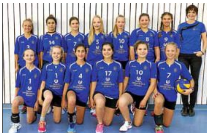
U 15 – U 17 weiblich, Mi 18:00 – 19.45 Uhr

Trainer + Kontakt: Markus Kliche - Markus.Kliche@live.de