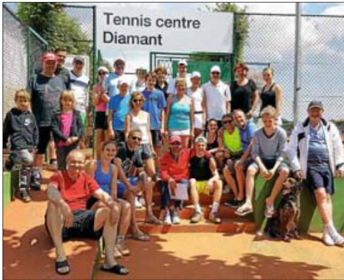
Teilnehmer des Tenniscamps 2016 SJ

Interesse? Dann schnell anmelden, Anmeldeschluss ist der 20. Dezember 2016.