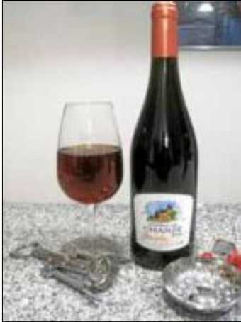
Le Beaujolais Nouveau 2016 vien d'arrivé

Das nördlich unserer Partnergemeinde gelegene Weinbaugbiet Beaujolais ist geographisch zwar ein Teil von Burgund, bildet aber aufgrund der anderen Charakteristik der Weine eine eigene Weinbauregion. Administrativ gehört das Beaujolais zum Département Rhône und damit zur Region Rhône-Alpes, wie unsere Partnergemeinde Marcy L'Etoile. Die Weinregion des Beaujolais erstreckt sich zwischen Lyon im Süden und Mâcon im Norden über eine Länge von rund 55 Kilometern und eine Breite, die selten 15 Kilometer überschreitet. Im Osten wird sie vom Tal der Saône begrenzt und im Westen von den Monts du Beaujolais. Bekannt ist sie für ihre im Charakter leichten, tanninarmen und früh zu trinkenden Rotweine, die aus der Sorte Gamay gekeltert werden. Als Weinbereitung wird bis auf seltene Ausnahmen die beaujolaiser Methode verwendet, die auf der Gärung von ganzen Trauben fußt. Das Beaujolais umfasst 72 Gemeinden, die sich grob in zwei Regionen aufteilen. Insgesamt umfasst das Beaujolais ca. 23.000 ha Rebfläche.