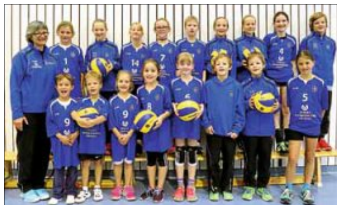
YOUNGSTARS FLACHT U 12 / U 13 / U 14 weiblich + männlich, Freitag 19.00 - 20.30 Uhr,