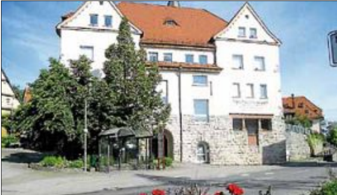
In den Vereinsräumen im Alten Schulhaus Flacht findet am Freitag die außerordentliche Generalversammlung statt.

alle Mitglieder am kommenden Freitag, 11. November 2016, 20 Uhr , zu einer außerordentlichen Generalversammlung in die Vereinsräume im Alten Schulhaus Flacht ein. Hauptpunkt der Versammlung sind die geänderten Vereinsförderrichtlinien der Gemeinde Weissach und deren Auswirkungen ab 2017 auf die Vereinsfinanzen. Alle Mitglieder erhielten bereits einen ausführlichen Informationsbrief der Vereinsführung.