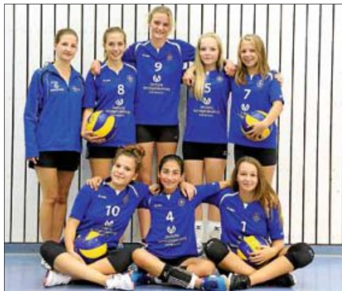
U 18 weiblich, Mo 18:00 -19:30 Uhr

Trainer + Kontakt: Markus Kliche - Markus.Kliche@live.de