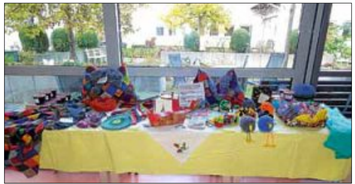
Hier fand jeder etwas