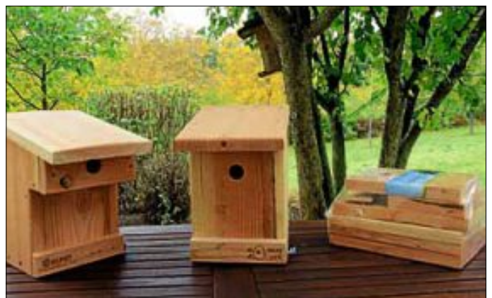
Nisthilfen mit und ohne Marderschut - jetzt aufhängen

Wir haben noch einen kleinen Restposten an Nisthilfen mit Marderschut (€ 25) oder normale Nisthilfen (€ 20), die gerne von