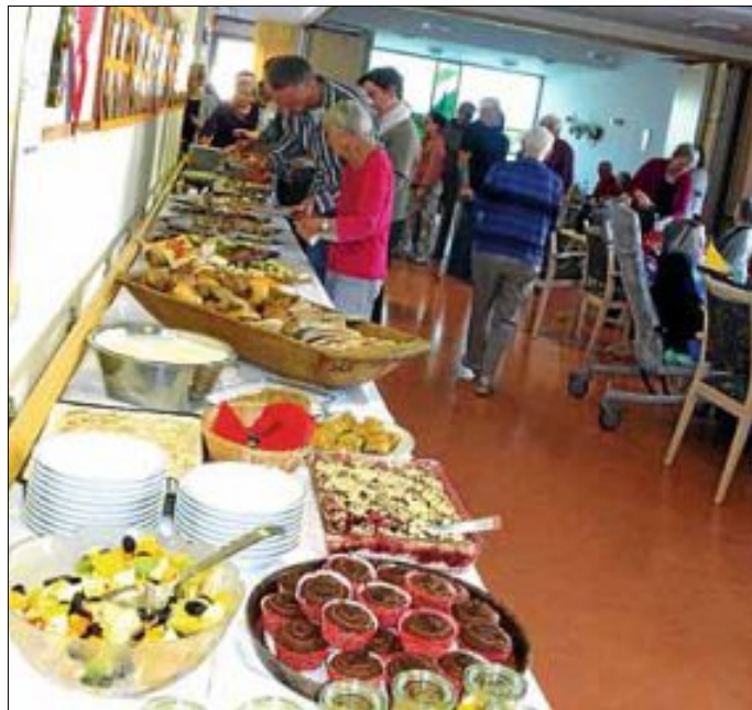
Alle bedienen sich am Buffet

Die Bewohner halfen bei der Herstellung der herrlichen Dekoration für die Tische, Fenster und Wände. Wie immer, ließ das Buffet auch in diesem Jahr keinen Wunsch offen, und so hatten alle die Qual der Wahl bei diesen vielen Köstlichkeiten. Die fleißigen Heinzelmännchen vom Küchenteam sorgten unentwegt für Nachschub, und die Anwesenden bedankten sich durch reichlichen Zuspruch.