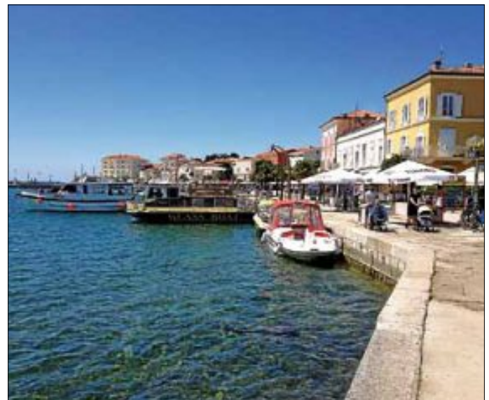
Porec - ein wunderschönes Städtchen in Istrien

Das Saison-Vorbereitungscamp 2017 des TC Weissach-Flacht findet wieder in Kroatien statt. Aufgrund der guten Resonanz wurde, wie letztes Jahr, das Hotel Valamar in Porec ausgesucht.