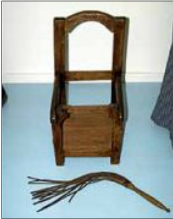
Exponat aus der Dauerausstellung

Führung durch die Dauerausstellung um 15.15 Uhr