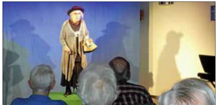
Die alte Dame mit Hund

Unter dem Motto „Herbstwege“ zeigten sie in wunderbarer Reimform mal humorvoll, mal besinnlich, die vielen verschiedenen Gedanken und Wege zum Herbst auf, sei es aus Sicht des Vogels, des Straßenkehrers, der Gärtnerin oder der alten Dame, die mit ihrem Hund zusammen nun alt und schwach geworden war. Gemeinsam mit den Bewohnern ließen sich auch viele Besucher von der Aufführung bezaubern.