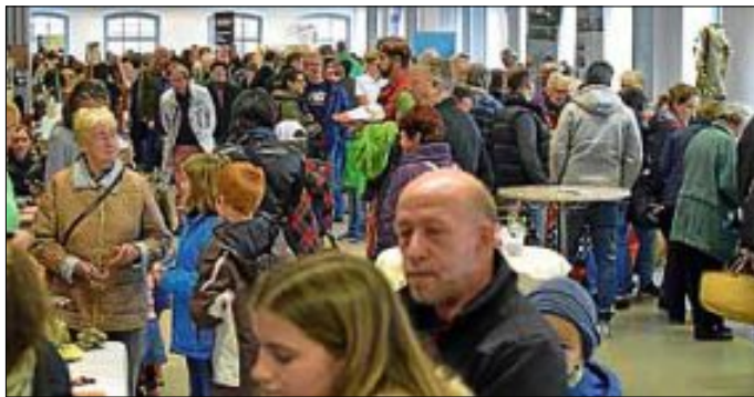
Marktgesehen im Innenbereich

Ohne die tatkräftige Unterstützung vieler ehrenamtlicher Helfer/innen ist die Organisation und Durchführung einer solchen Veranstaltung natürlich nicht möglich, vielen Dank an alle, die in irgendeiner Form dabei mitgewirkt haben. Danke aber auch an Sie, dass Sie all die Jahre schon durch Ihren Besuch den Markt so erfolgreich machen.