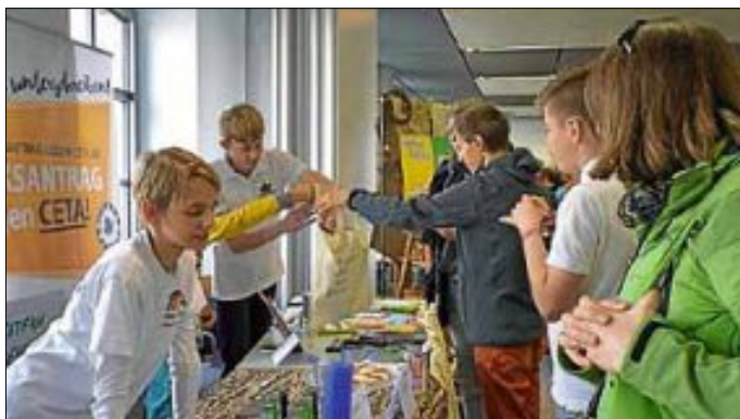
Besucher bei "GREENTEAM Schwabenpower"

Bei den Händlern, die am Markt teilnehmen, kommt es immer wieder zu Veränderungen, es kommen neue Marktbesucher dazu, andere nehmen aus unterschiedlichsten Gründen nicht mehr teil. Neu (unter anderem) bei unserem diesjährigen Markt war die Teilnahme vom „GREENTEAM Schwabenpower“ . Wir finden es bemerkenswert, dass diese Gruppe Jugendlicher, „die es sich zur Aufgabe gemacht hat, unsere Zukunft, sicherer, ökologischer, sozialer, fairer und enkeltauglicher zu machen „ (Zitat aus der Homepage) am Markt teilgenommen und diesen durch ihre Informationen bereichert haben.