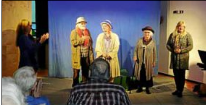
Dank zum Abschied