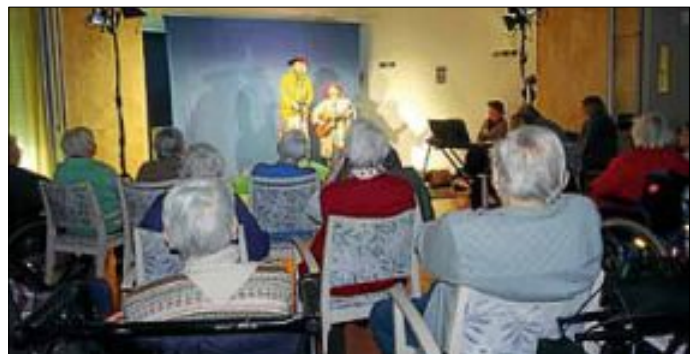
Gemeinsam wird gesungen