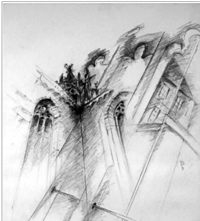
Irmgard Lang-Röhrle: Bebenhausen

An diesem Sonntagnachmittag wird es nicht nur um Fotografien des Kloster Bebenhausen von 1870 bis heute gehen, die Werner Popp zusammengestellt hat, sondern es wird zusätzlich gezeigt, wie die Zeichnerin Irmgard Lang-Röhrle den Gebäudekomplex und Details davon mit dem Zeichenstift wiedergibt. Die Künstlerin ist anwesend.