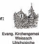
Evang. Kirchengemeinde Weissach Ulrichskirche