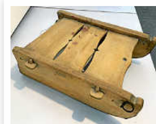
Alter Holzschlitten im Heimatmuseum Flacht

Die Abfuhr war dringend nötig, damit das Museum mit den Vorbereitungen für den Aufbau seiner nächsten Sonderausstellung zum Thema „Winter“ beginnen kann. Diese soll noch im Januar eröffnet werden und an die Zeiten erinnern, als es auch in Weissach und Flacht noch richtige lange Winter mit viel Eis und Schnee