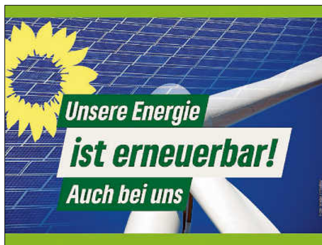
Plakate: Grüne Weissach+Flacht