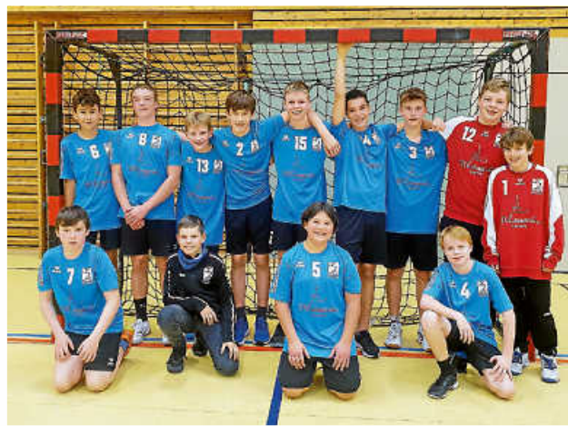
Mannschaftsfoto mit Spielern aus Weissach und Rutesheim