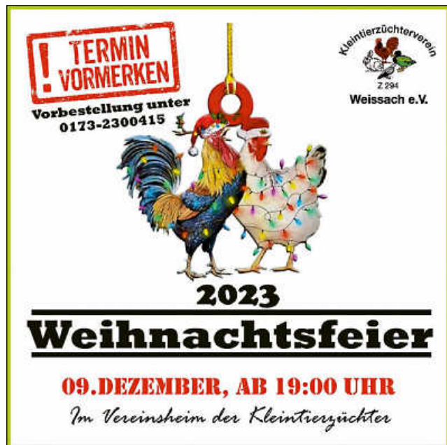
Plakat: Link, Marco

ßen zu dürfen. Wir beginnen mit einer kurzen Ansprache und im Anschluss lassen wir diese bei gemütlichem Beisammensein mit unserem Weihnachtsessen ausklingen. Es gibt dieses Jahr eine leckere Gulaschsuppe. Um besser planen zu können, bitten wir um Voranmeldung.