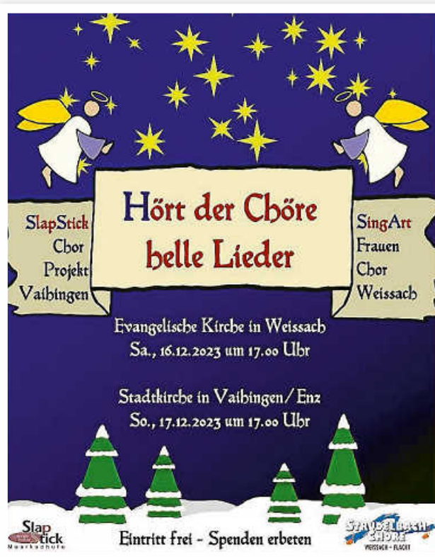
Plakat: StrudelbachChöre Weissach und Flacht