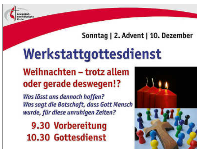
Plakat: EmK Weissach

Kath. Kirchengemeinde St. Clemens Weissach