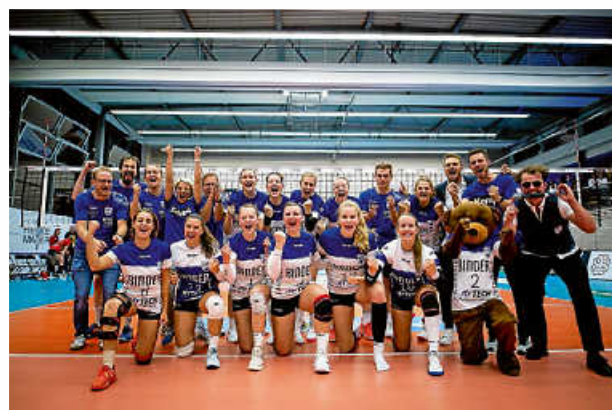
1. Heimspiel 30.09.2023

ders hervorzuheben ist die herausragende Leistung der Binder Blaubären in der Feldabwehr. Sie zeigten beeindruckende Abwehraktionen und eine erstklassige Teamarbeit, die ihnen den Sieg ermöglichte.