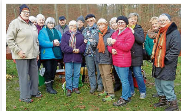
Wärmere Kleidung wird zeitweise auch angesagt sein.

Die Gruppen treffen sich in der dunklen Jahreszeit jeweils am Dienstag und Donnerstag ab 09.00 Uhr.