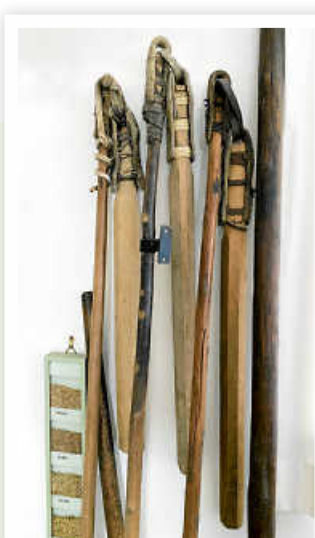
Dreschflegelsortiment in der landwirtschaftlichen Abteilung des Heimatmuseums

Aus dem landwirtschaftlichen Alltag sind sie schon lange verschwunden: Sichel, Sense und Dreschflegel. Heute stehen die Werkzeuge symbolisch für die alte, von Mühsal und Handarbeit geprägte bäuerliche Welt, die im Laufe des 20. Jahrhunderts sukzessive von der modernen, maschinellen Landwirtschaft abgelöst wurde. Nachdem sie ihren praktischen Nutzen verloren hatten, fanden die Geräte hier und da noch als Deko-Objekte Verwendung. Oder sie wanderten in die ab den 1970er Jahren entstehenden Heimatmuseen. So auch in Weissach und Flacht.