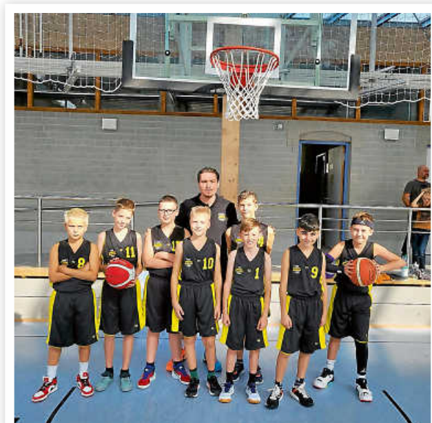
Mannschaftsfoto U12 M

gesamte Mannschaft – die Jungs haben ein gutes Umschaltspiel und großartige Korbaktionen gezeigt. Am Ende mussten wir zwar nach Punkten den Sieg abgeben, haben aber an erster Erfahrung klar gewonnen. Die nächste Herausforderung steht bereits auf dem Plan am 22.10.2023 um 09:00 geht es nach Malmsheim zum TSV.