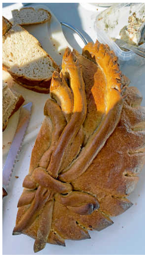
Brot für Erntedank von der Bäckerei Clement

Nach dem Gottesdienst trafen sich die Gottesdienstbesucher noch zu einem Brunch mit Brot, Hefekranz, Schmalz, Marmeladen und neuem Wein. Wir danken insbesondere der Bäckerei Clement, die auch in diesem Jahr das Erntedankbrot kostenlos zur Verfügung stellte.