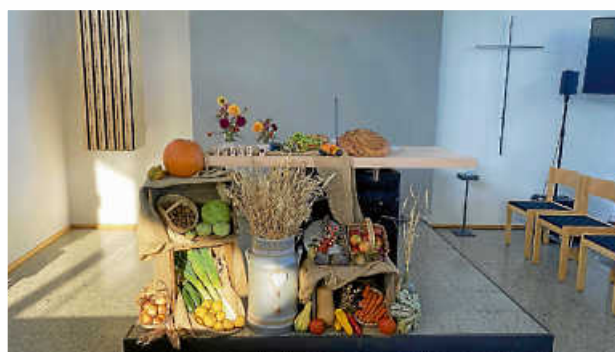
Altar Erntedank 2023