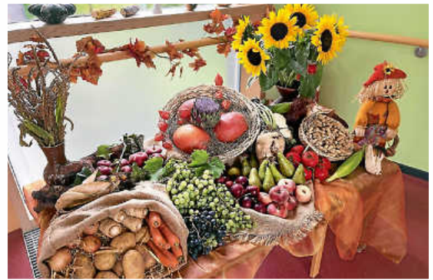
Erntedanktisch im Rosa-Körner-Stift