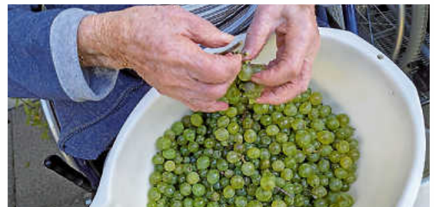
Traubenlese, viele fleißige Hände