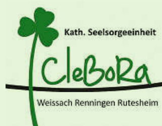
Grafik: G. Weihermann

Familihtag am 15. Oktober in Weissach – WIR SIND MIT DABEI! Komm vorbei im katholischen Gemeindehaus in der ERLEBNIS-ZEIT von 14.15 Uhr bis ca. 16.00 Uhr. Lass dich überraschen von tollen Mitmach-Aktionen. Wir freuen uns auf dich!