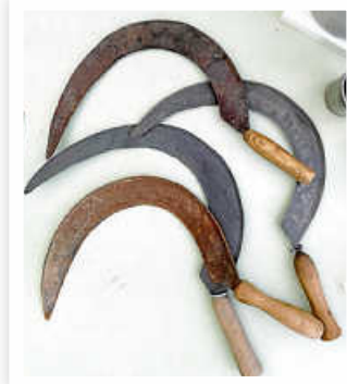
Haben bereits Rost angesetzt: Sichel zum Schneiden von Gras und Getreide im Heimatmuseum.

verloren hatten, fanden die Geräte hier und da noch als Deko-Objekte Verwendung. Oder sie wanderten in die ab den 1970er Jahren entstehenden Heimatmuseen. So auch in Weissach und Flacht.