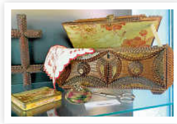
Selbstgebasteltes Nähkästchen aus alten Zigarrenkisten im Tramp-Art-Stil aus der Zeit um 1900