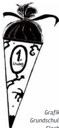
Grafik: Grundschule Flacht

Zum Schulanfänger – Elternabend am Dienstag, 12. September 2023 um 19.30 Uhr im Klassenzimmer der 1a und 1b statt