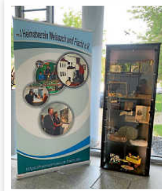
Zum Denkmalstag zeigt das Heimatmuseum Flacht eine Auswahl seiner Objekte in einer Vitrine im Weissacher Rathausfoyer.

Seit vielen Jahren schon ist Weissach am bundesweiten Tag des offenen Denkmals ein wichtiger Anlaufpunkt in unserer Region. Mit dem gut erhaltenen Areal der ehemaligen Kirchenburg kann die Gemeinde mit einem Baudenkmal aufwarten, das es in dieser Form nun wahrlich nicht überall zu sehen gibt.