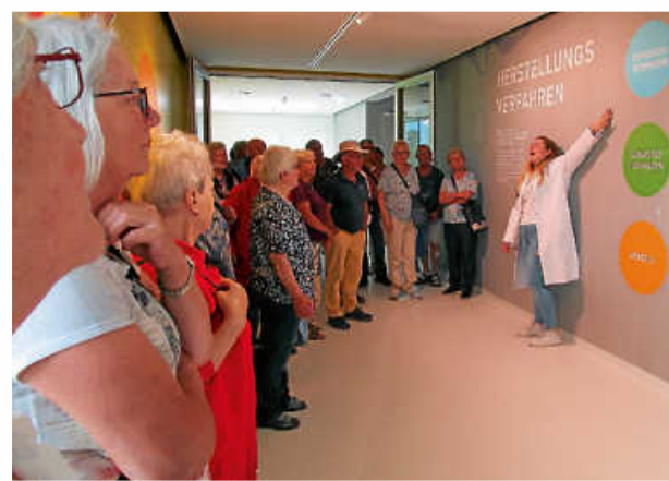
Informationen zur Nudelherstellung

wie z.B. Buchweizen. Naturstoffe wie Rote Beete, Tomaten, Spinat oder Sepiatinte konnen zum Farben der Nudeln verwendet werden. Es gibt verschiedene Verarbeitungsprozesse, wie gewalzte und gepresste Nudelteige oder Spatzle, unterschiedlichste Auspragungen von Spiralen, Hornchen, Spatzle und Knopfle, groe und kleine Rohrennudeln. Buchstabennudeln bis hin zu Sauriern zeigen die Fulle der moglichen Formen an. Vom Besuchersteg konnte man die imposanten Maschinen, Forderbander mit Nudeln, Trockeneinrichtungen bis hin zur Verpackung der Nudeln bestaunen.