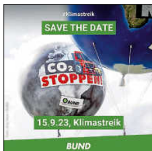
Grafik: BUND Baden-Württemberg