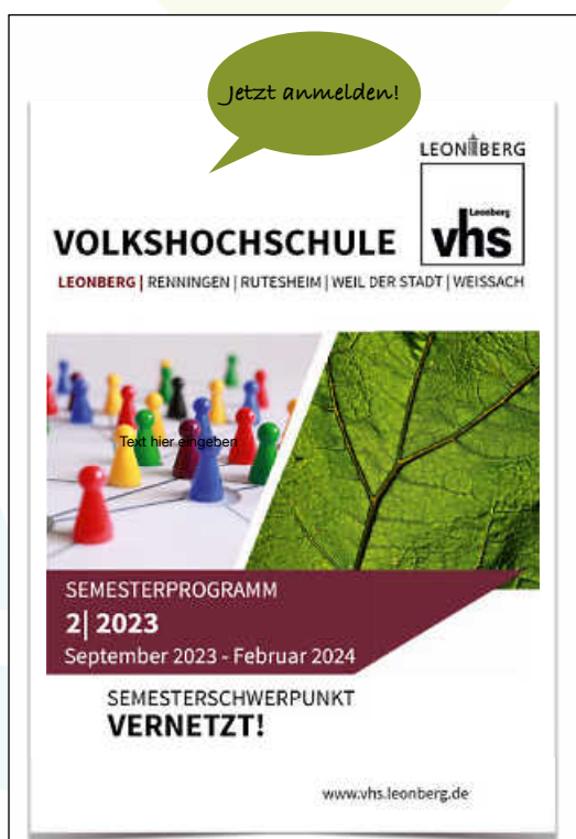
Cover 2.2023