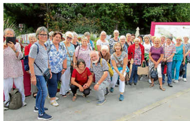
Bei der Landesgartenschau in Balingen

Nach dem Mittagessen ging es weiter nach Balingen, wo wir die Landesgartenschau besuchten. Nicht nur Blumen und Zierpflanzen, sondern auch viel Interessantes zu Gartengestaltung, Kunstobjekten und der Renaturierung und Neugestaltung der Eyach konnte erkundet werden. Mit dem Wetter hatten wir viel Gluck und konnten so die Gartenschau genieen.