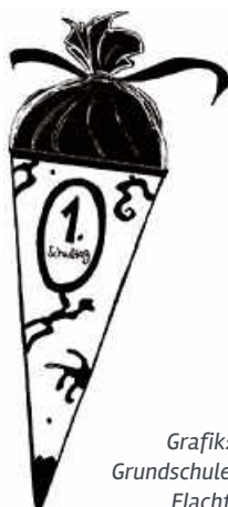
Grafik: Grundschule Flacht

zum Schulanfänger – Elternabend am Dienstag, 12. September 2023 um 19.30 Uhr im Klassenzimmer der 1a und 1b statt