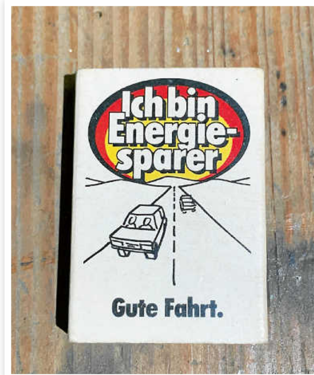
Streichholzschachtel aus dem Jahre 1980: „Ich bin Energiesparer“.

An seiner schieren Größe lässt sich der kulturgeschichtliche Wert eines Gegenstands bekanntlich nicht festmachen. Der Gegenstand, den wir heute vorstellen wollen, hat exakt die Maße 5 cm × 3,5 cm × 1,5 cm. Dabei handelt es sich um das Miniaturformat schlechthin: die Streichholzschachtel.