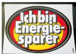
Der Slogan war v.a. als Autoaufkleber sehr beliebt.

43 Jahre später beschäftigt uns das Thema mehr denn je. Der Aufkleber im Retro-Styl wurde inzwischen auch hier und da wieder neu aufgelegt.