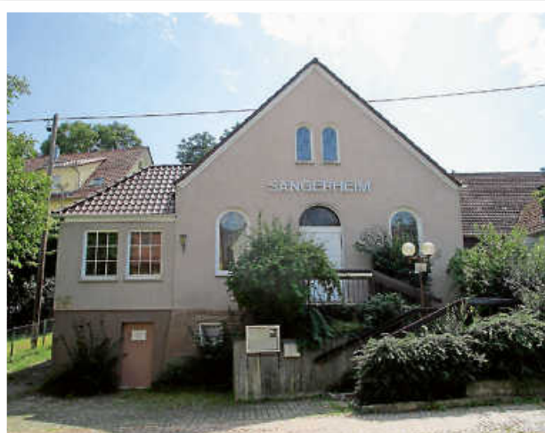
Sängerheim der StrudelbachChöre Weissach und Flacht