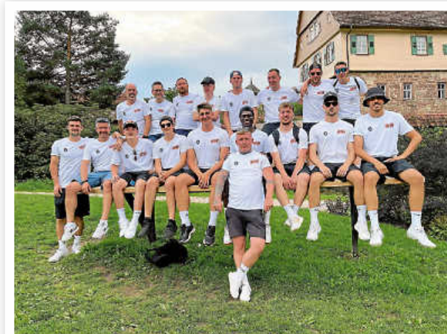
Trainingslager 2023 in Baiersbronn.

Der TSV Flacht in der Vorbereitung! Am vergangenen Wochenende hatte man ein dreitägiges Trainingslager in Baiersbronn absolviert. Am Samstag, den 26. August, erwartet man um 15.00 Uhr die SpVgg Mönshheim zu einem Freundschaftsspiel. In der 1. Bezirkspokalrunde spielt man am Mittwoch, den 30. August, um 18.30 Uhr beim TSV Weissach II. Danach geht es schon los mit dem Saisonauftakt in der Kreisliga A. Am Sonntag, den 3. September, spielt man um 15.00 Uhr beim TV Möglingen und eine Woche später ist der TSF Ditzingen zu Gast in Flacht.