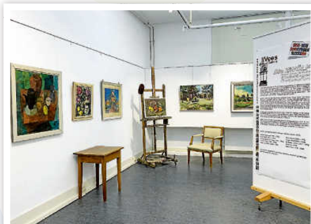
Blinck in die Ausstellung „Sepp Veas und die Sindelfinger Sezession“, die nun zu Ende geht.

Wer noch einmal die aktuelle Jahreshängung in der Galerie Sepp Veas „Die Zwölf – Sepp Veas und die Sindelfinger Sezession“ sehen will, der hat am Sonntag, 21. April, dazu die letzte Gelegenheit. Danach gehen die Arbeiten der Sezessionskünstler wieder zurück in die Galerie der Stadt Sindelfingen. 1958 hatten sich 12 Künstler und Künstlerinnen aus der Region