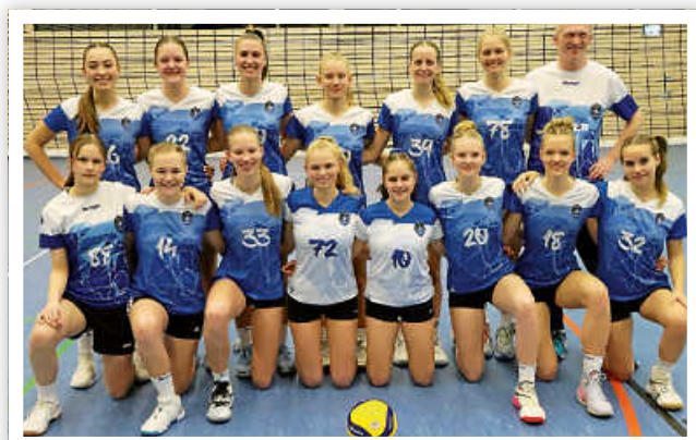
Mädels der Blaubären TSV Flacht U18