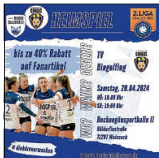
Heimspiel 20.04.2024 Plakat: Binder Blaubären TSV Flacht