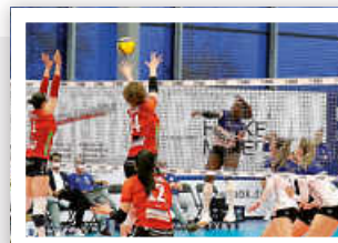
BBG vs. NawaRo Straubing

Am Abend des 06.04.2024 fand in der heimischen Halle der Binder Blaubären Flacht ein spannendes Volleyball-Match gegen die Gäste von NawaRo Straubing statt. Die Begegnung versprach Spannung, denn beide Teams hatten sich auf einen intensiven Schlagabtausch vorbereitet.