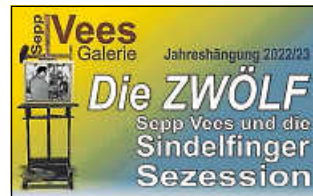
Grafik: Peter Haug